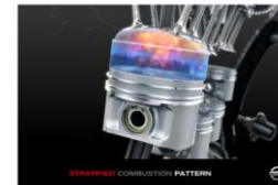
例) 自動車のエンジン