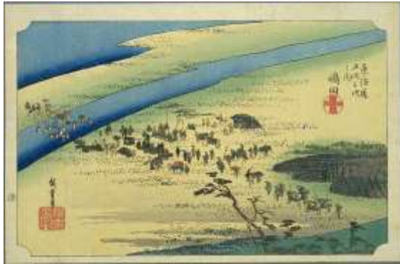
歌川広重 東海道五十三次・嶋田