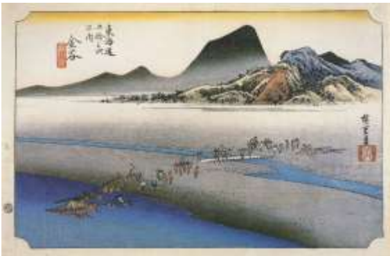
歌川広重 東海道五十三次・金谷