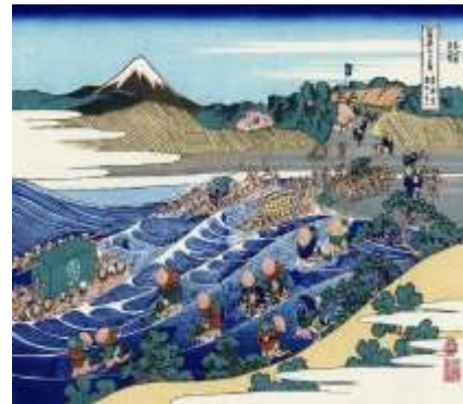
葛飾北斎 東海道・金谷の不二